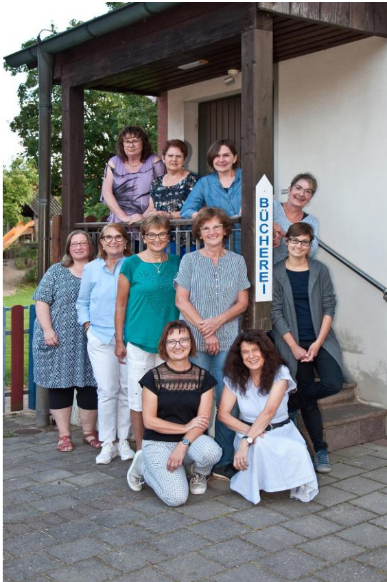
(zwei Mitarbeiterinnen fehlen auf dem Bild)

Unser Team bestand 2022 aus 13 ehrenamtlichen Mitarbeiterinnen und einem Mitarbeiter, dem die Administration unserer Bibliothekssoftware obliegt. Auch nach den anstrengenden vergangenen Jahren war das Team stets mit großer Begeisterung bei der Arbeit.